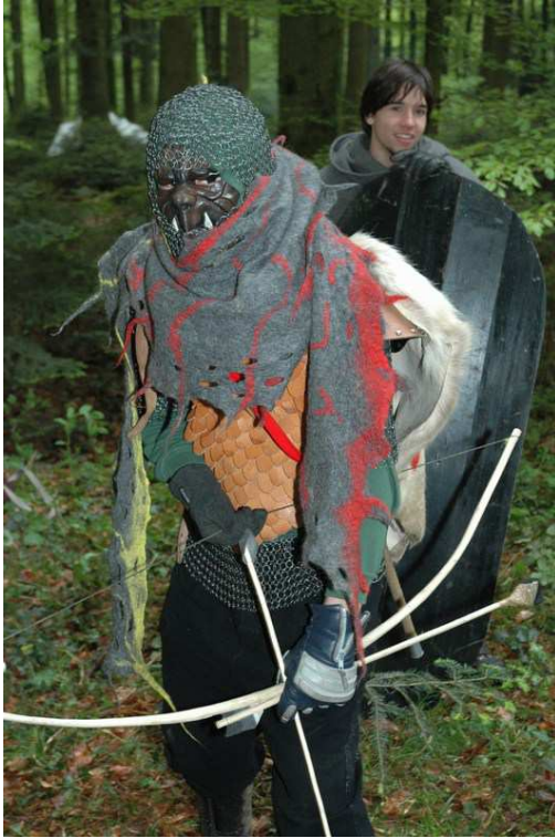
leichte Kette + Leder (2 RP)