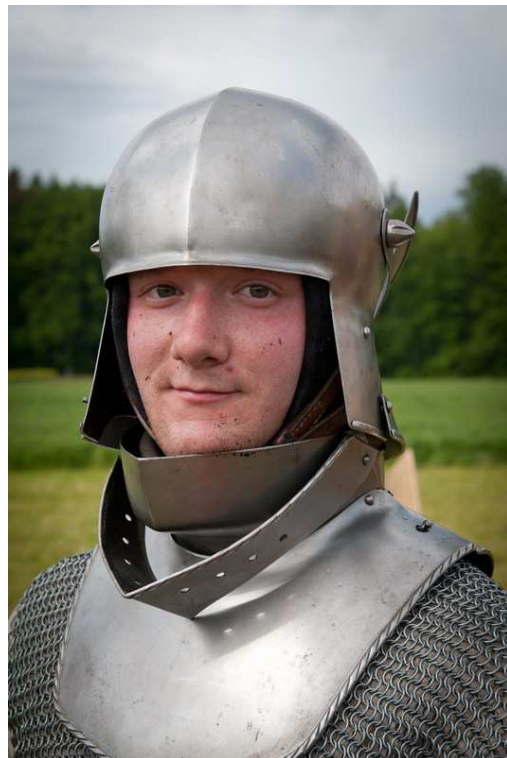
schwere Kette + Platte (3 + RP)