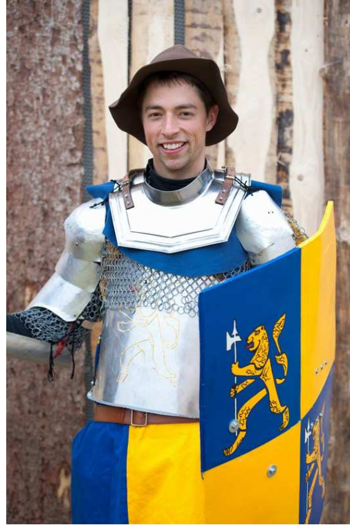
leichte Kette + Blech (2 RP)