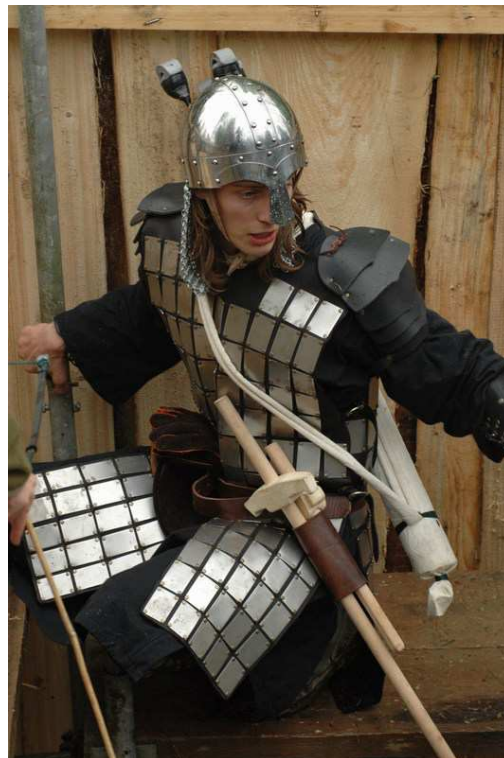
Schuppenpanzer (2 RP)