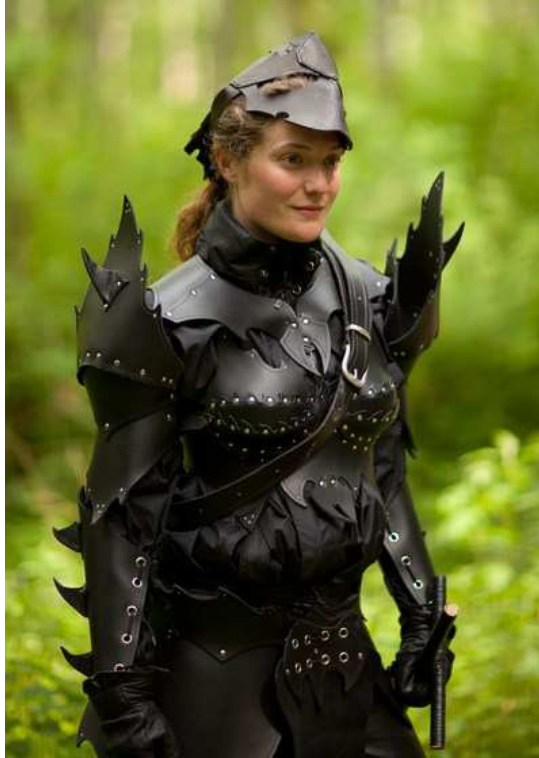
Leder (1 RP)