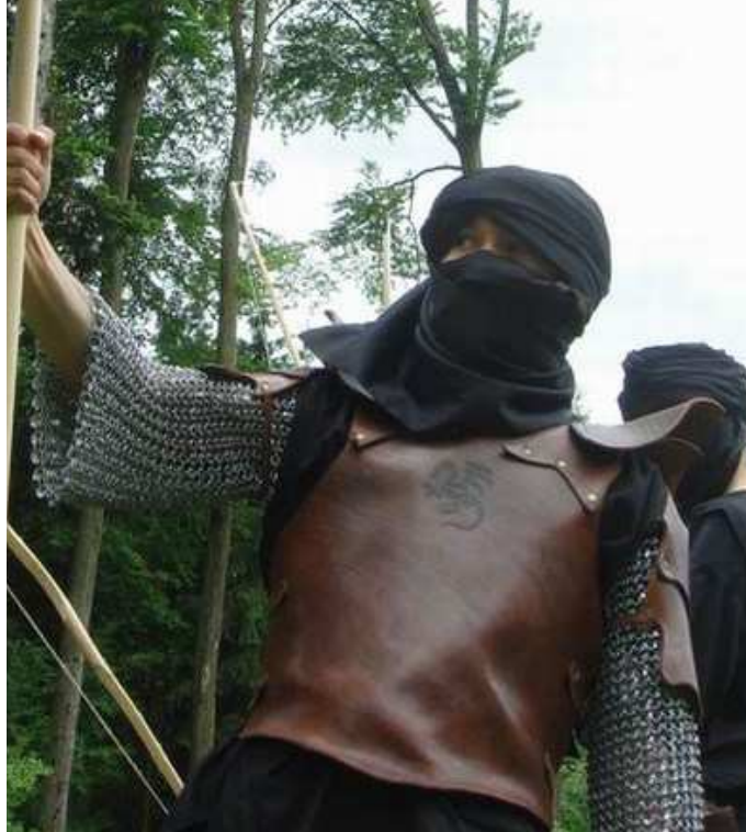
schwere Kette + Leder (3 RP)