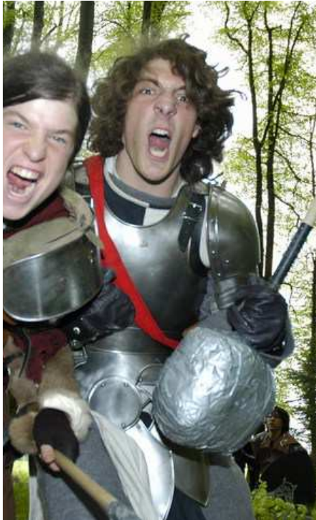
Platte (2 RP)