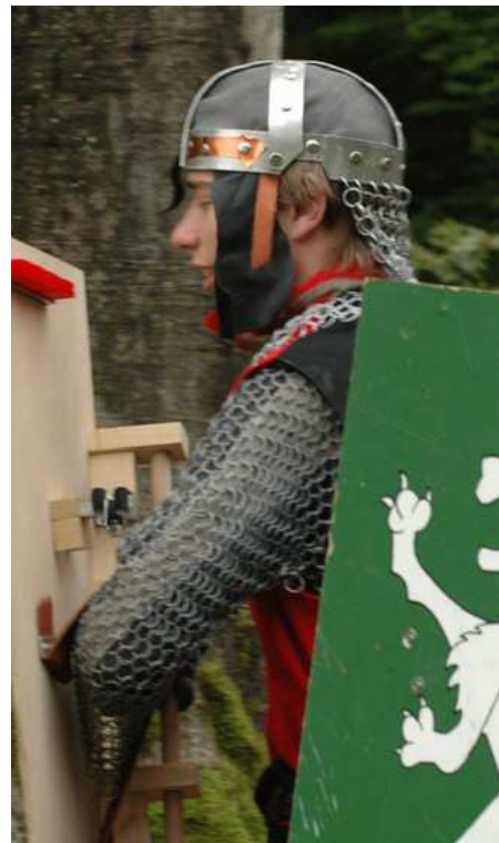
leichte Kette (1 RP)