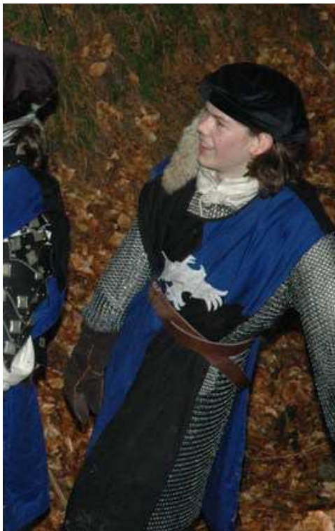
schwere Kette (2 RP)