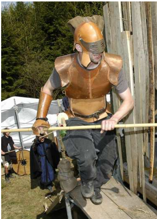
Blech (1 RP)