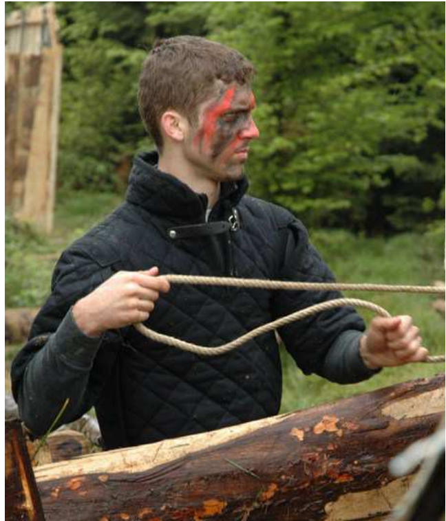
Gambeson (1 RP)