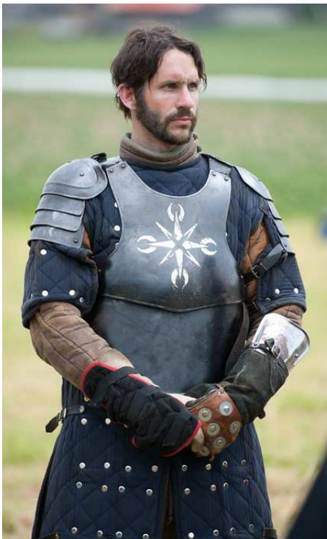
Schuppenpanzer + Platte (3 + RP)